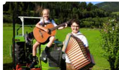
Huck di her- Musi