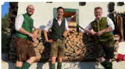
Murtaler Kirchtagsmusi (Wanderbegeleitung)