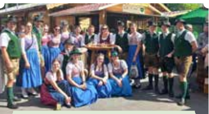
Heimat- und Trachtenverein d'Freistoana z'Gröbming