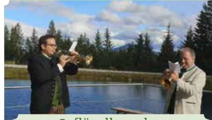
Geflügelhornduo (Wanderbegleitung 1)