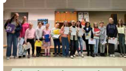
Chor der Erzherzog-Johann Musikschule Wies