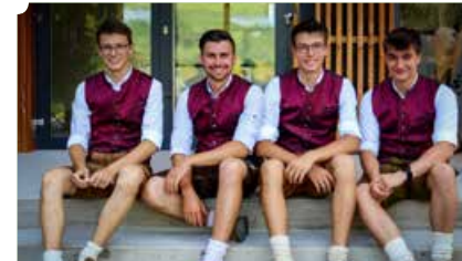
Die Buam von Dahoam