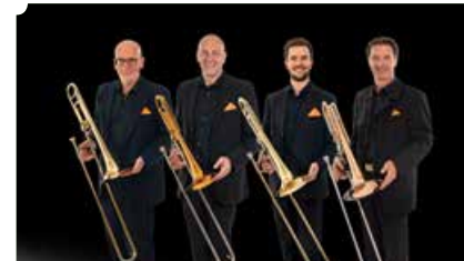
DL Trombone Connection