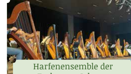
Harfenensemble der Erzherzog-Johann Musikschule Wies